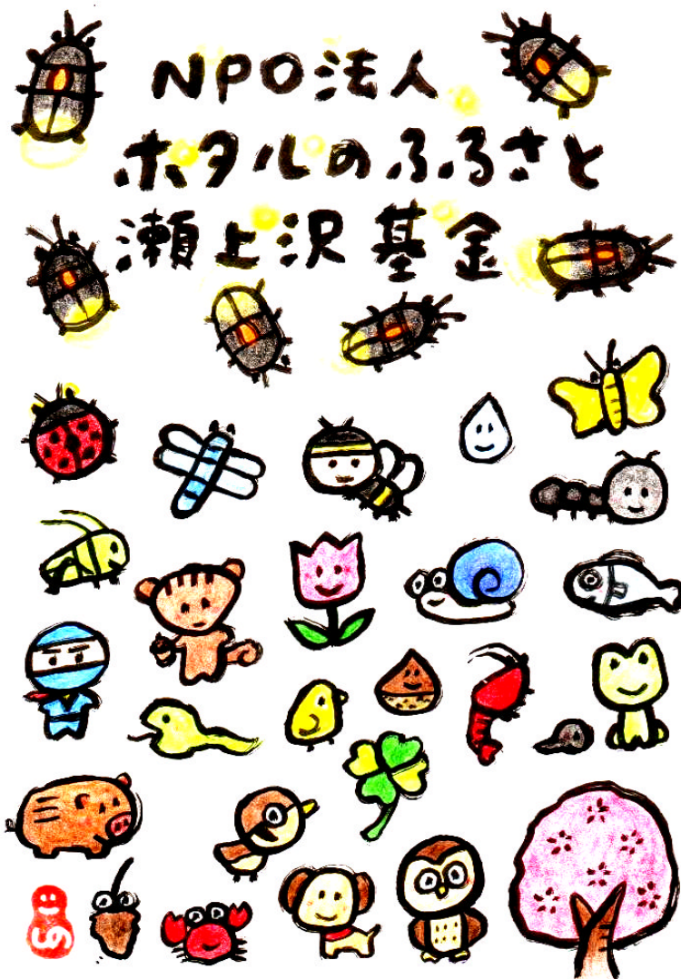
イラスト 篠原克暢

瀬上沢基金は、緑地守り、豊かな生態系や古代製鉄遺跡などを後世に残す為、土地取得・借入をめざして寄付や会員を募っています